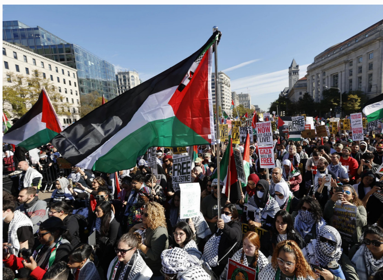
"Free Palestine" rally in Washington, D.C

Israel's Prime Minister Benjamin Netanyahu has rejected the idea of any ceasefire "without the return of our hostages". The United States has advocated instead for "humanitarian pauses" to allow civilians to flee and for aid delivery.