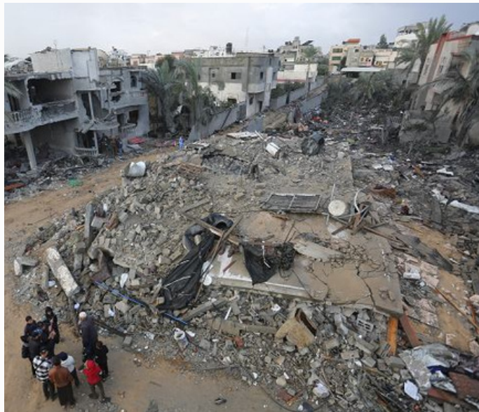
The aftermath of bombings in Gaza

Many of the protesters were friends and family members of the captives and demanded their immediate return.